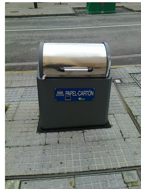
SOTERRADO 4.000 L