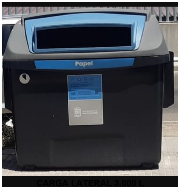
CARGA LATERAL 3.000 L