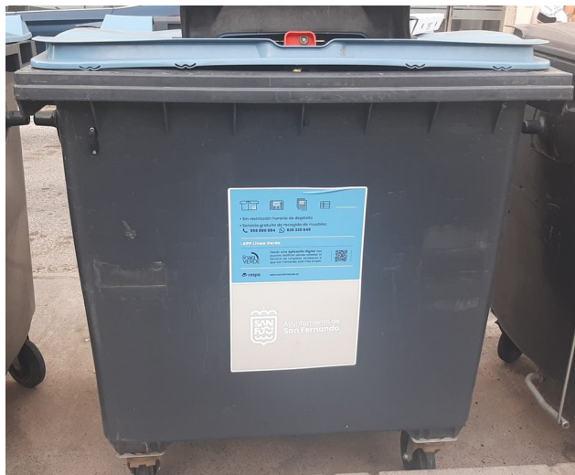
CARGA TRASERA 1.100 L